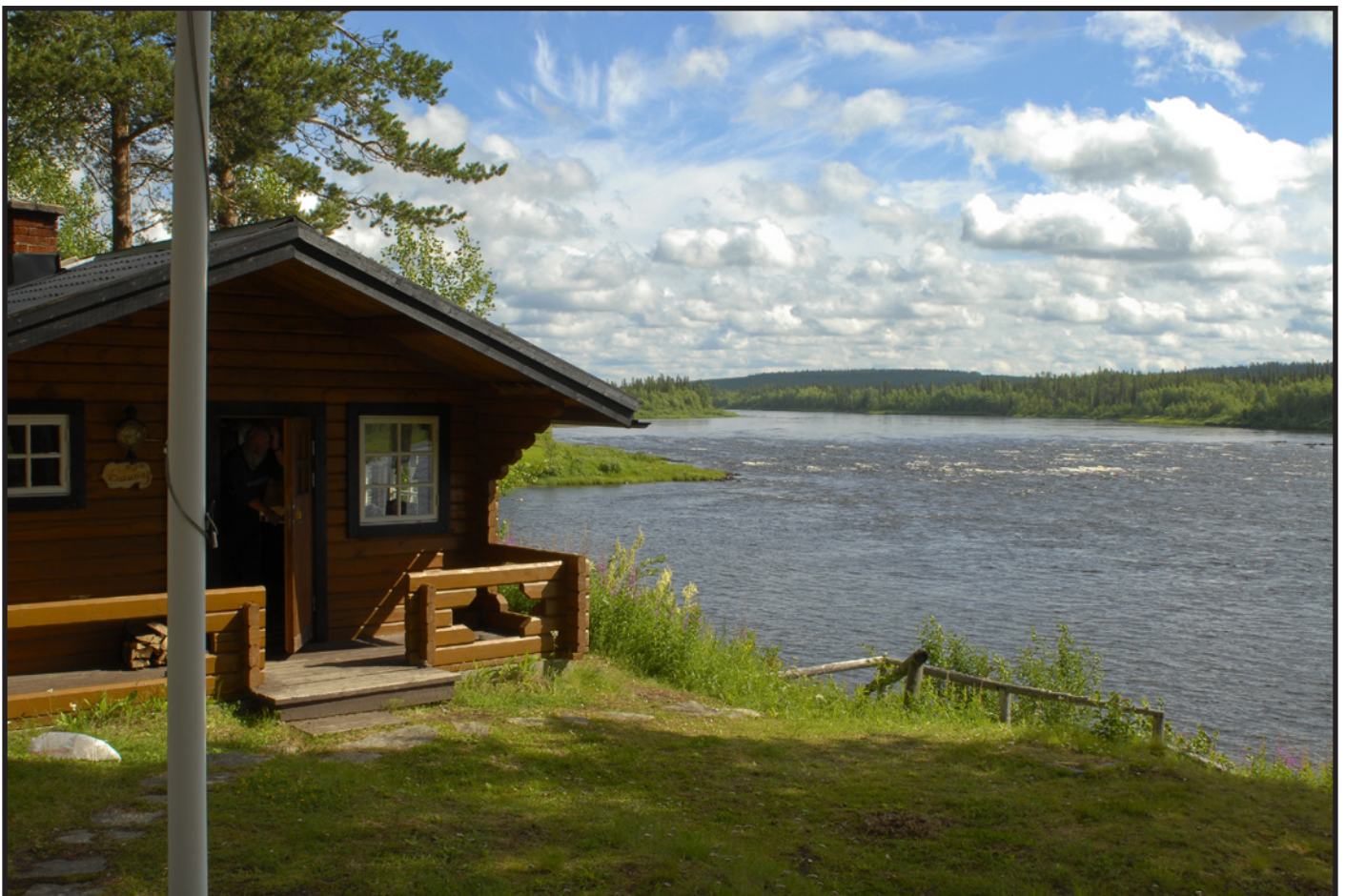
Bastustugan med forsen Kaalamakoski i bakgrunden.

www.pajala.se www.pajalaturism.bd.se www.rajamaa.com www.kengisbruk.se