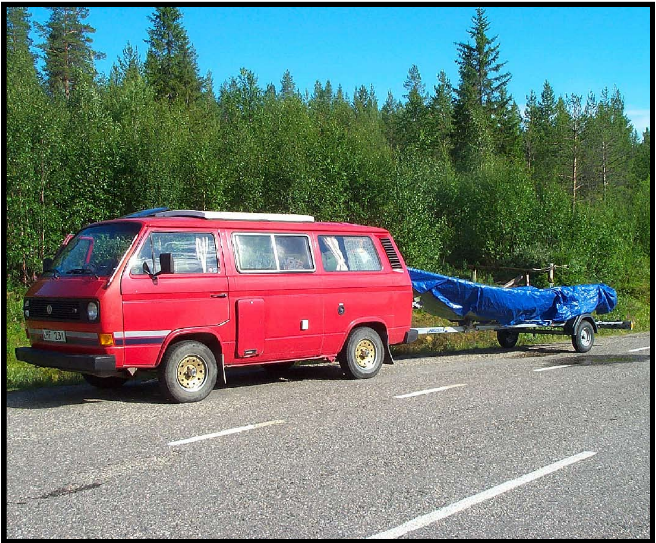
Ett ekipage som sett många fiskevatten.