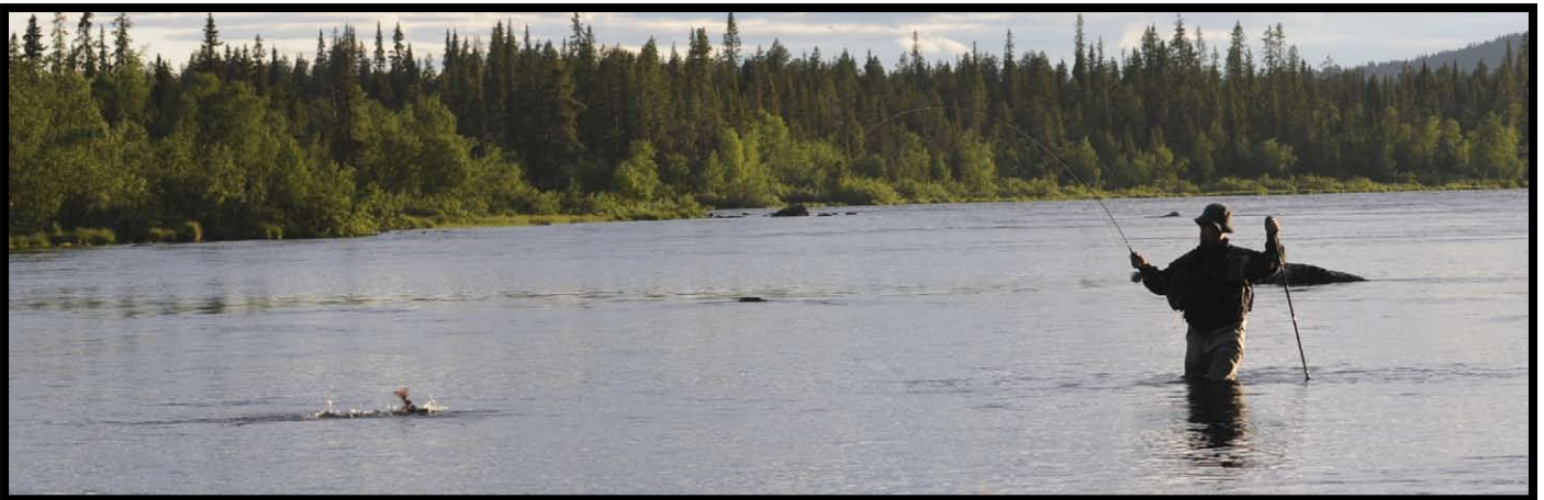
Kan man kalla detta för "Head and Tail".