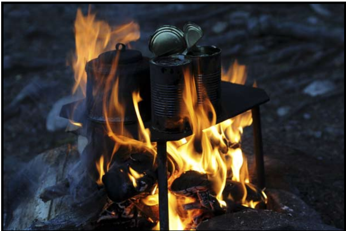
Ibland är det bättre än fiske.